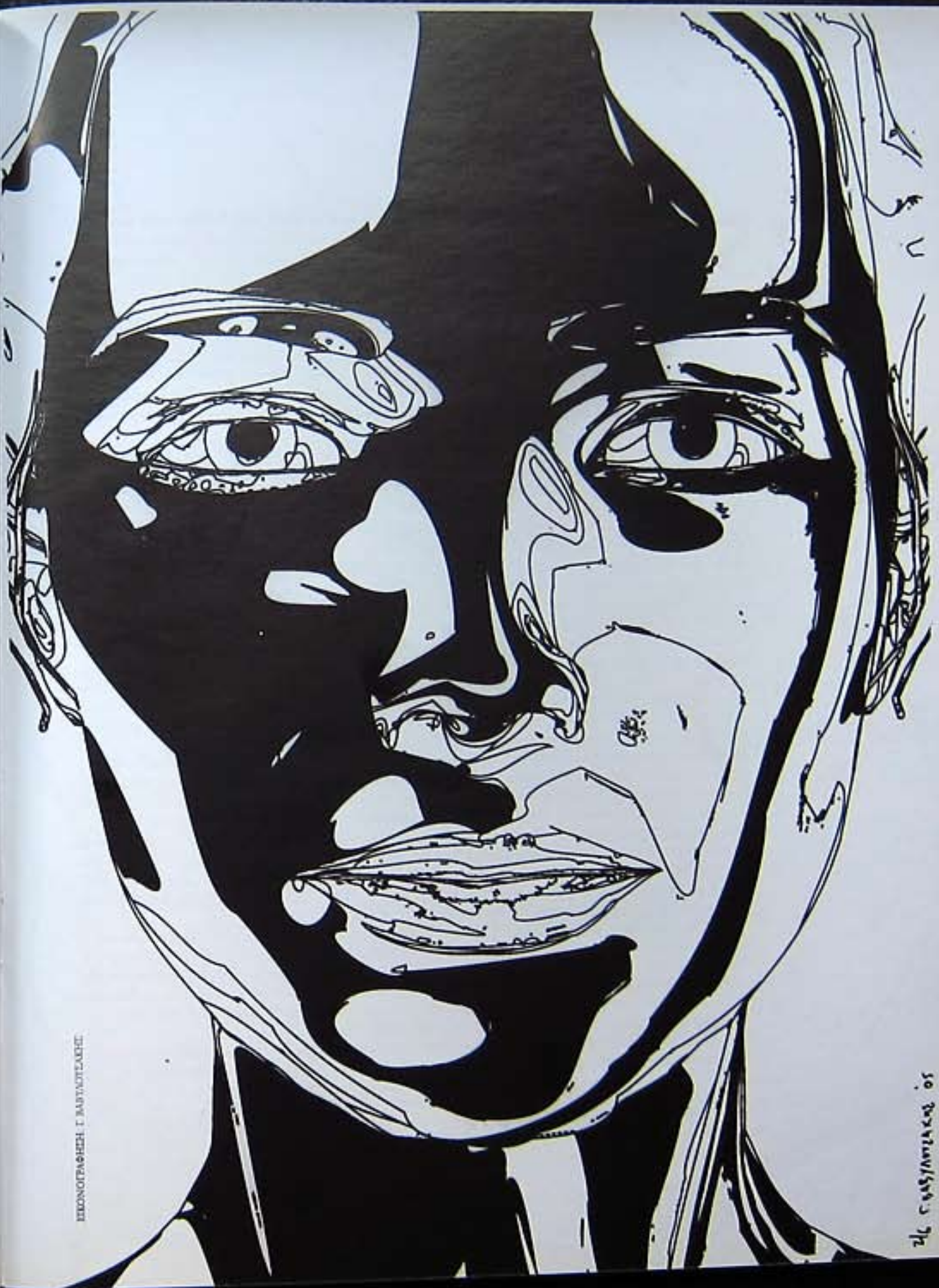
ΕΙΚΟΝΟΓΡΑΦΙΕΣ Τ. ΒΑΡΥΤΟΠΛΑΧΗΣ